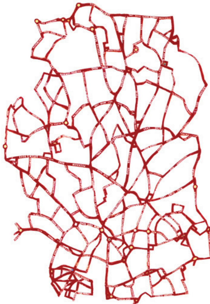
Title Red Road Arteries - 2012