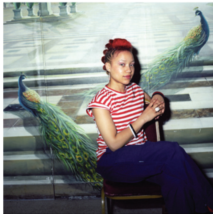
Title Afro Hair and Beauty Show - 2003

Between 1998 and 2003, Perrier visited the Afro Hair and Beauty Show, which took place annually in London at Alexander Palace. She would find a different location at the venue each year and set up a temporary studio in which visitors were invited to pose for their portrait. These images of individuals showcase the changing trends in African- Caribbean hair styling and fashion.