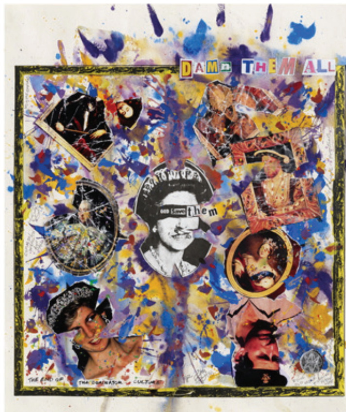
Title Damn Them All - 1993 - Newsprint collage and gouache on paper, 610mm x 520mm

«لغت به همه آنها» به سفارش روزنامه گاردین در ۱۹۹۳ تهیه شد. این اثر شامل بسیاری از عناصری است که هنرمند همیشه به آنها پرداخته، مفاهیمی چون به چالش کشیدن سلسله مراتب قدرت و سیاست با اشارات قوی گوشه‌های پاره شده تصاویر و چین‌خورگی‌ها و پاشیدن رنگ روی آنها.