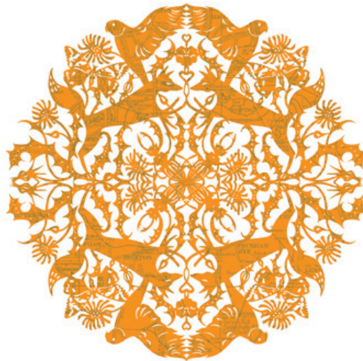
Title Circus - 2012 - Giclee print on paper عنوان سیرک - ۲۰۱۲ - چاپ دیجیتال روی کاغذ