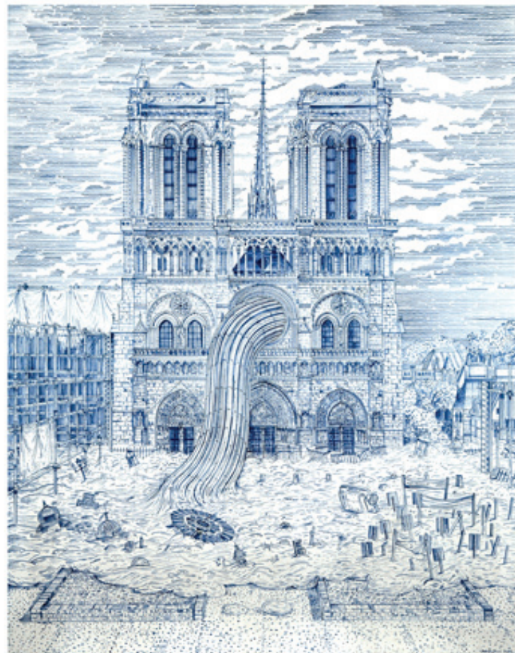
Title French Substance - 1989

I hope in representing such a bizarre and inappropriate trope, to signal the revelation of more primal social interactions and to redress the disproportionate levels of power held by the advertising and marketing culture of today's society.