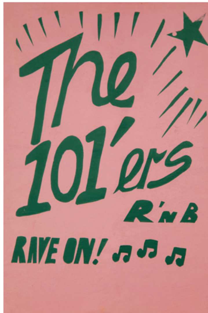
Title The 101's Rave On - 1975

جنون ۱۰۱، پوستر گروه ۱۰۱، با تکنیک سریگرافی به طراحی استرومر در کارگاه چاپ پدینگتون (بعدها استودیو چاپ لندن) در سال ۱۹۷۵ چاپ شد. آهنگی که این مجموعه آثار نامش را از آن وام گرفته، "London Calling" (لندن فرا میخواند) نام دارد که توسط جو استرومر و مایک جونز نوشته شده، استمرار روح سرکش فرهنگ پانک بود که بصورت فرهنگی فراگیر در جهان تکثیر شد. بعد ها استفاده از رنگ های سبز و صورتی این پوستر در طراحی جلد آلبوم London Calling بکار گرفته شد.