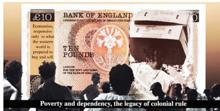
About The Work درباره اثر

ECU: European Currency Unfolds was originally commissioned for the exhibition Shifting Borders at the Laing Gallery, Newcastle by curator Richard Hyton. The artwork is concerned with black (African, Asian, Caribbean and Arabic) minority communities living across Europe who have long been contributing to the social, economic and cultural fabric of the larger significant European states. It addresses how such communities are bound by the economic value and financial configuration of Europe as the predominant cheap work force. The work explores racial formation, tension and racism as it persists. This goes hand in hand with each country's history as it does with the present status of black European citizens – exploring the notion of citizenship, rights and justice.