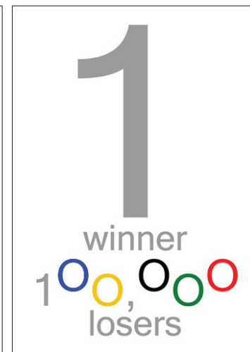
Title 1 Winner - 2012 عنوان برنده نخست - ۲۰۱۲