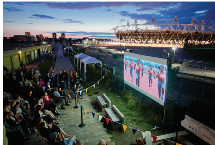
Title Stadium - 2012

Stadium is a photograph taken by Daniel Thomas at the View Tube during the June 2011 premiere of Abdu'Allah's film Double Pendulum , curated by Invisible Dust which took place at sun-set with the backdrop of the London 2012 Olympic Stadium.