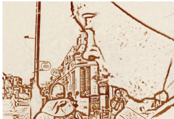
Title CCTV - 2008 - Silk screen print on paper

او می‌گوید، "CCTV (دوربین های امنیتی مدار بسته) یک اثر سریگرافی است که هنگام کار روی «پروژه‌ها» که متمرکز بر فرهنگ دارودسته بازی و بازپروری مجرمین جوان بود تولید کردم. جالب این جاست که برخی از آن نوجوانان دوربین‌های امنیتی را به هنگام ارتکاب جرم نه تنها به‌عنوان عامل بازدارنده قلمداد نمی‌کردند، بلکه آنرا وسیله ای برای مطرح شدن خود میدانستند و بعضی دیگر نسبت به "پیوسته تحت نظر بودن" احساس شدید ناراحتی میکردند. هدف CCTV مطرح کردن این سؤال است که آیا چشم "برادر بزرگ" باعث برقراری امنیت شده یا اینکه خود سبب ناآرامی و تشدید معضلات است."